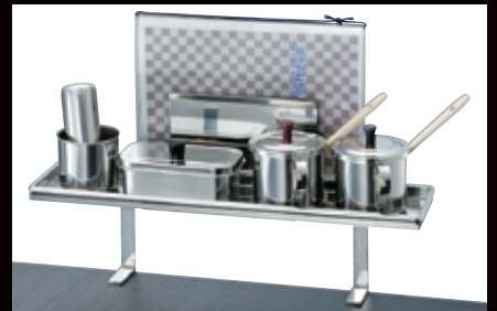
メニュースタンド (付属品は別売) ¥14,000